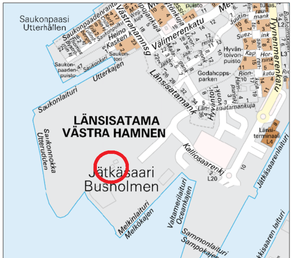
Kuva 1. Jätkäsaaren valmisbetonitehtaan sijaintipaikka.

Valmisbetonitehdas sijaitsee Helsingin 20. kaupunginosan (Länsisatama) Jätkäsaaren länsiosassa (Kuva 1). Alueen omistaa Helsingin kaupunki, joka on vuokrannut alueen Rudus Oy:lle 31.1.2021 asti. Tehdasalueen suuruus on kaksi hehtaaria.