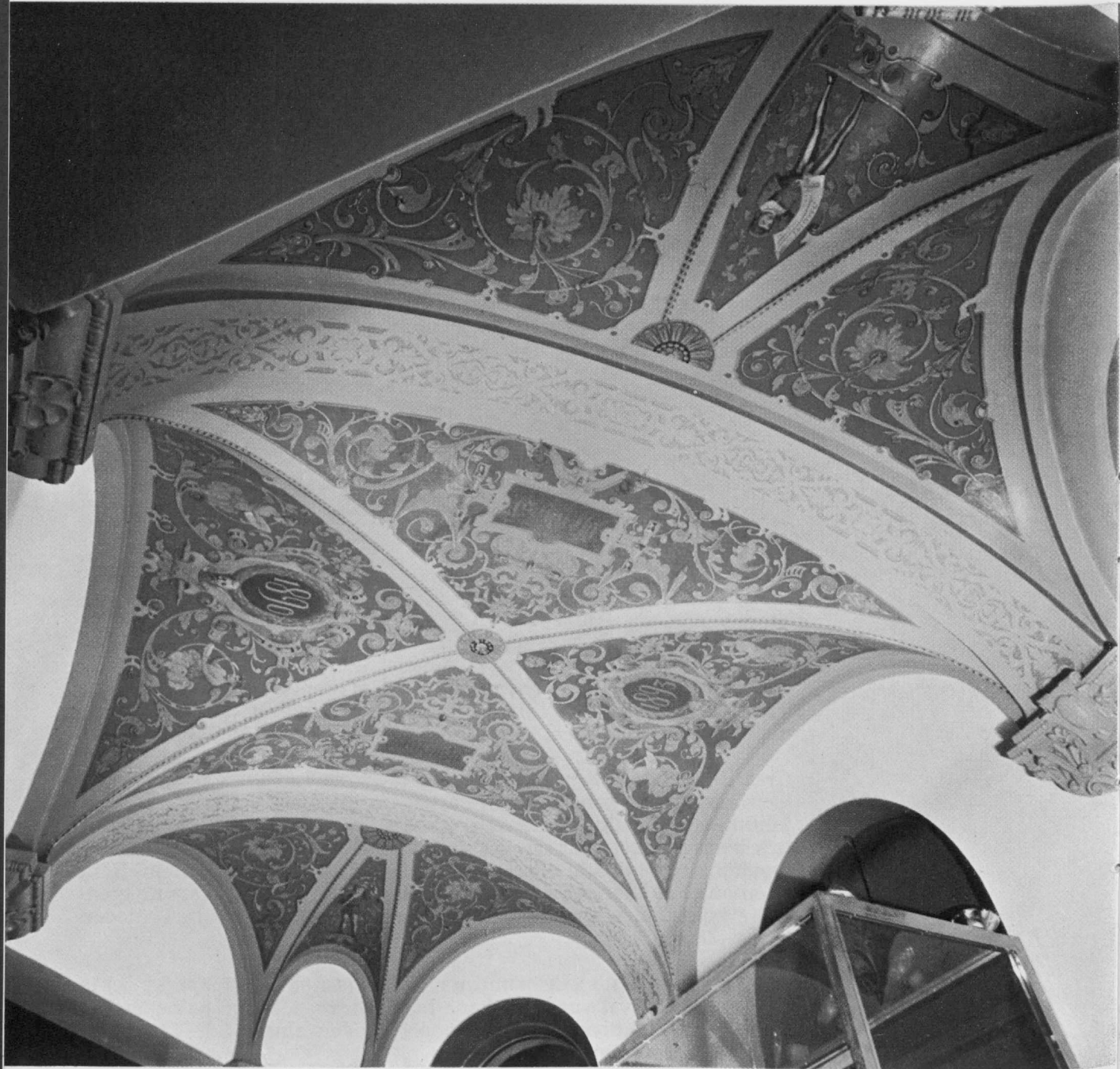
Kattomaalaus Ludviginkadun yleisöpalvelutilassa